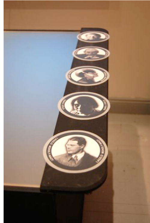
Figuras 3 y 4. visualización de los datos en la televisión y detalle de las cartas circulares o markers

Durante el proceso de diseño de la visualización de los datos, se llegó a la conclusión de que el usuario debía explorar el contenido de una manera activa, disfrutando de una experiencia intuitiva y plenamente interactiva. Esto fue posible ya que se tradujo toda la información en ítems simplificados y se representaron mediante iconos relativos a las categorías, lo que conformaría una nueva interpretación visual y electrónica de la idea de caption . Esta idea podría describirse sencillamente como el paso tácito que reduce la información textual en información visual.